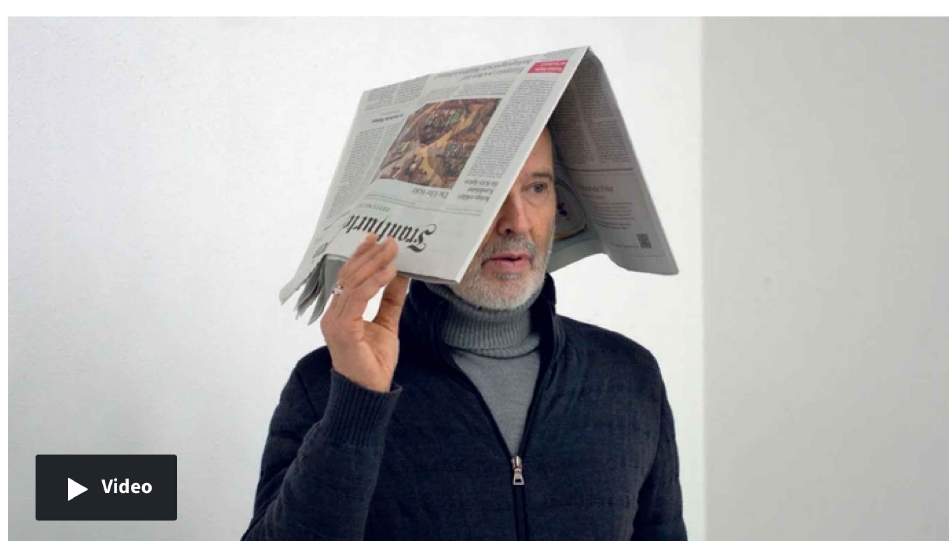
Erwin Wurm zur -Kampagne

Bereits im Jahr 2003 hatten die Red Hot Chili Peppers in ihrem Musikvideo „Can't Stop“ einen ganzen Teebeutelvorrat von „One Minute Sculptures“ des österreichischen Körperbildhauers am eigenen Leib durchgespielt. Mit unmittelbar eingängigen, wenngleich surreal verfremdeten Bildern wie dem Singen in Mülltonnen – seit Kindheitstagen bekannt durch Oscar aus der Sesamstraße – oder dem Tanzen mit einem Eimer auf dem Kopf zitiert der Clip-Regisseur Mark Romanek Wurms Arsenal der unbegrenzten Absurditäten.